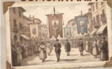
FOTO DI VITA COMUNITARIA

Vecchie feste patronali, processioni solenni e momenti liturgici del passato.