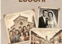
Foto di paesaggi del paese ormai scomparsi o di volti noti del paese

VORREMO ORGANIZZARE UNA MOSTRA FOTOGRAFICA PER CELEBRARE IL CAMMINO DELLA COMUNITÀ ATTRAVERSO I DECENNI.